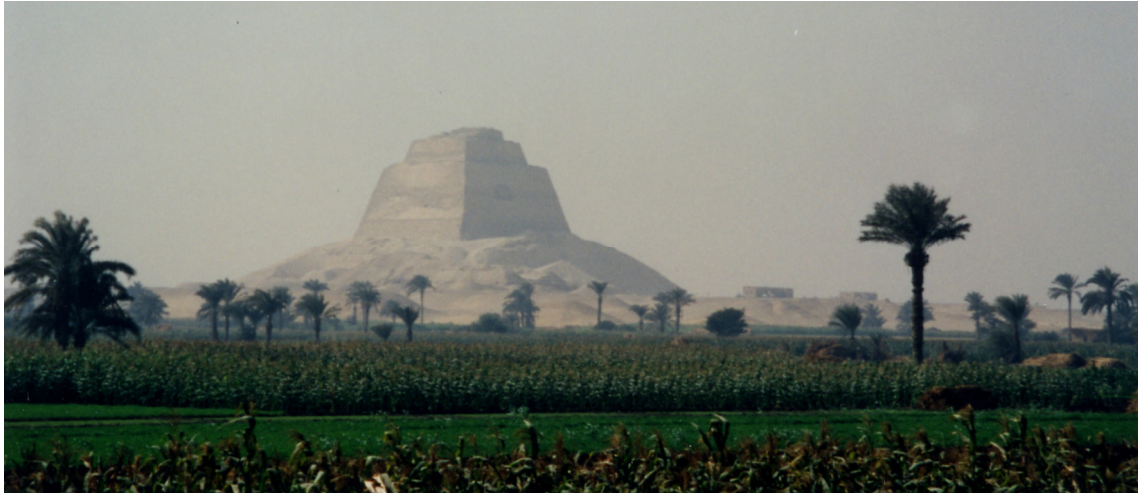
La pyramide vue de la vallée

CSÉG 12, 1 et CSÉG 12, 2, Genève 2013 (2 fascicules : texte et planches)